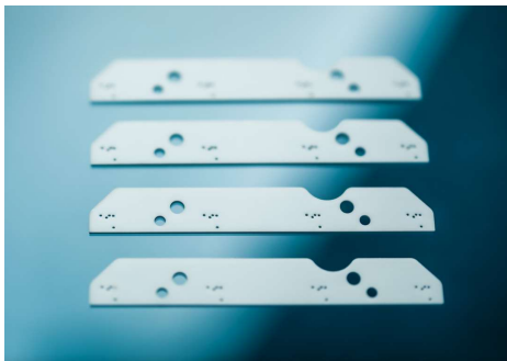
セラミックプレート